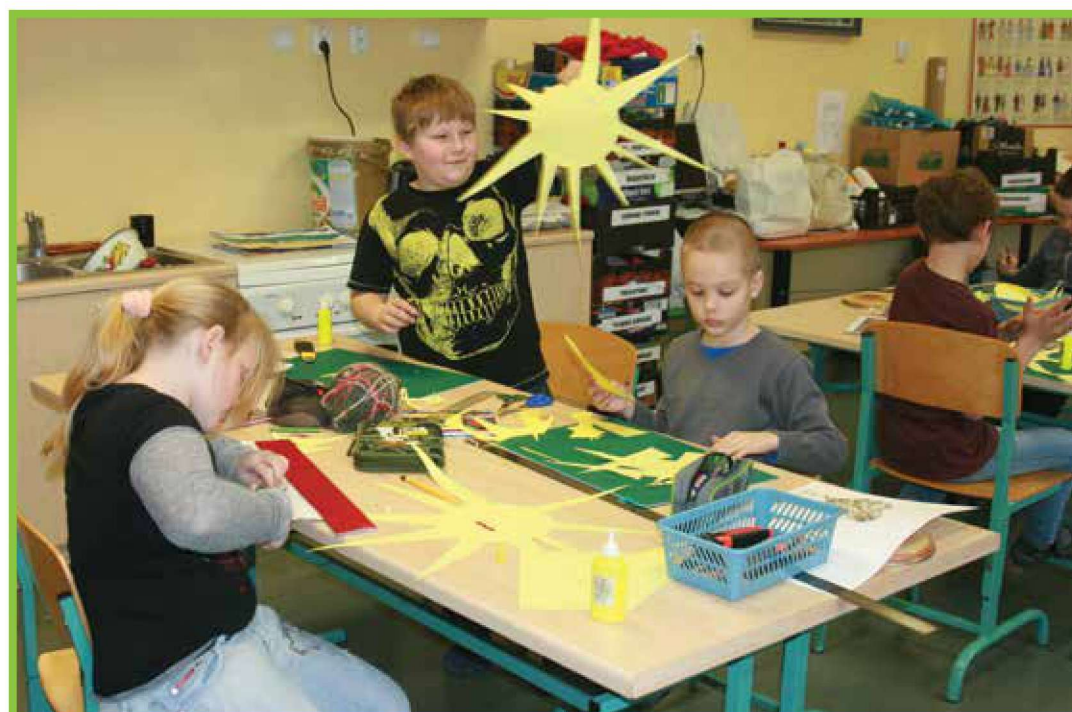
1.-2. klass kunstitunnis