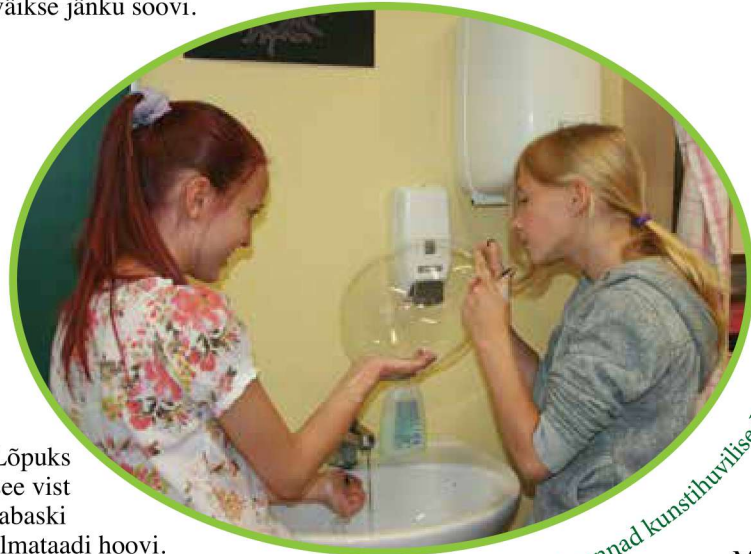
Sõbrannad kunstihuvilised Talv. „Misasja?! On ju nii.“

Terve mets andis edasi väikse jänku soovi.