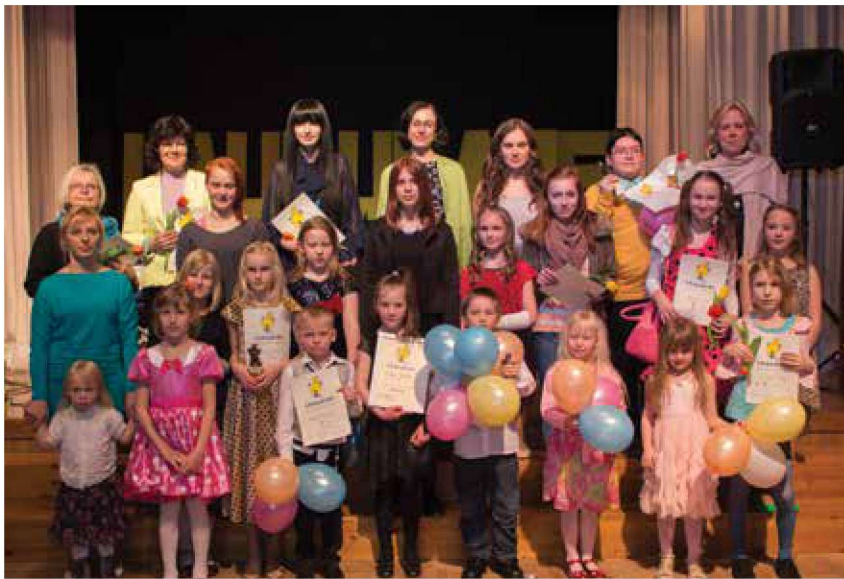
Laululapsed, õpetajad, žürii

Kalender oli kuulutama aprillikuu seitsmeteistkümnendat päeva, kui Haibasse oli kogunenud kevadet kuulutama siinse valla kõige helisevamate häältega noored selgitamaks välja parimatest parim siinpool Kasari jõe – Kernu Valla Laululaps 2014.