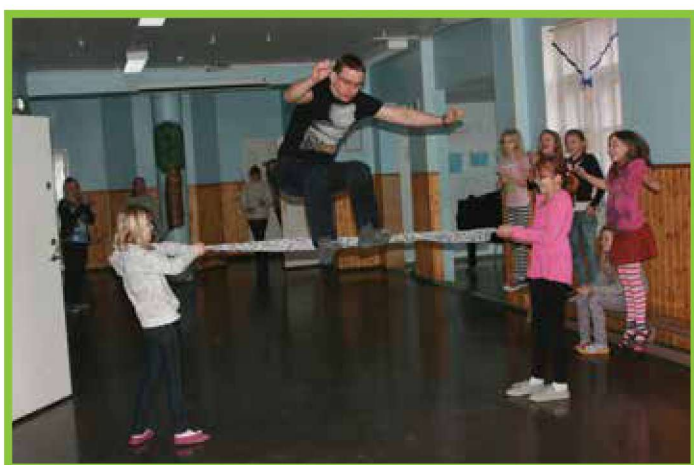
Sportmängud vahetunnis - õpetaja hüppamas