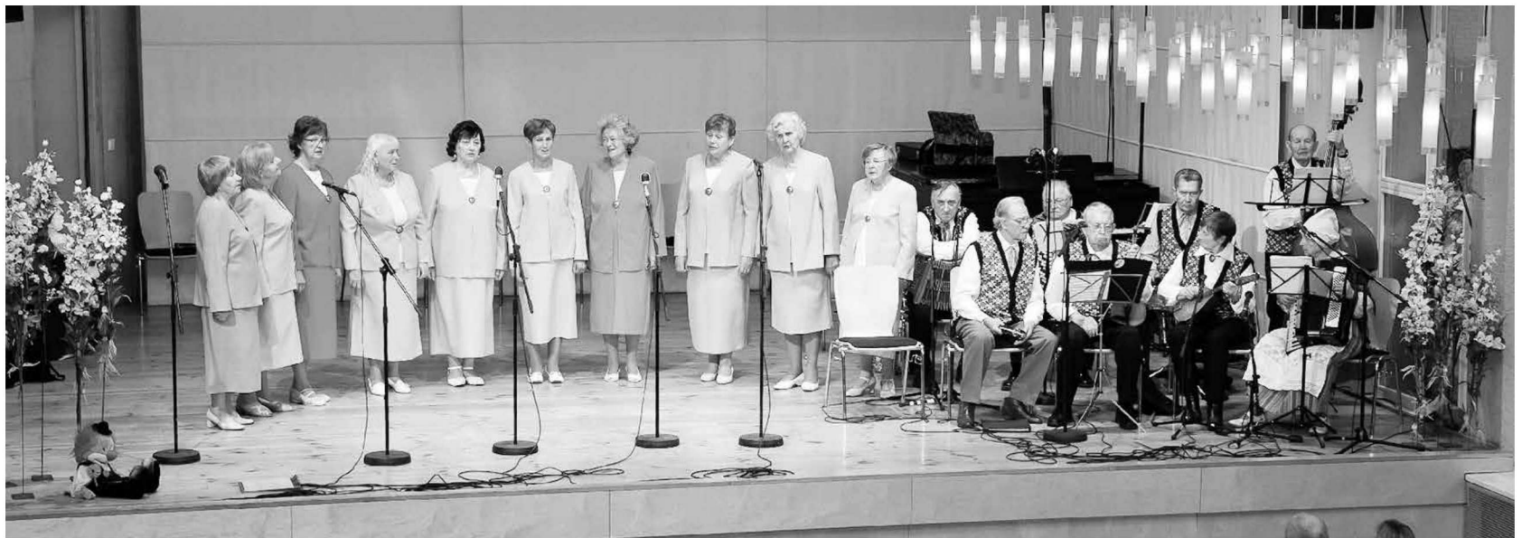
Vannamuudu juubelikontserdil täiskooresseisus Kandle laval.