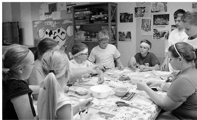
Seikluslaagris osalejad meisterdamas.

Laagris õpiti oskust meeskonnana töötada ja võtta vastutust ning arvestada erinevustega meie ümber. Suurt tähelepanu pöörati loovusele ning koolis õpitud oskustele igapäevaeluga: tehti teaduskatseid ning tut-