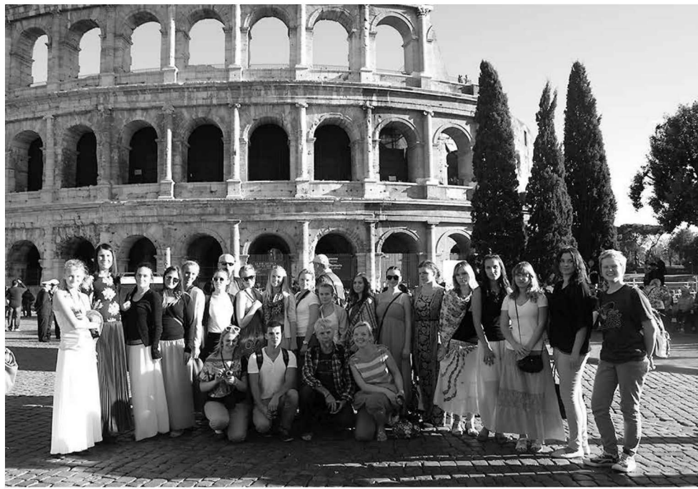
Reisilõpped Colosseumi juures.

Esimene linn, mida Itaalias külastasime, oli San Marino. San Marino on maailma vanim vabariik, mis asub Monte Titano mäel. Mäe tipu ronides oli kuulda ohkeid, kuna vaade oli lihtsalt hingematvalt ilus. Pärast pilteideldades vaadates oli pettumus suur, kuna nii kaunist vaadet oli võimatu pildile püüda. Need vaated tuli talletada mälu. Õpilasi hullu-