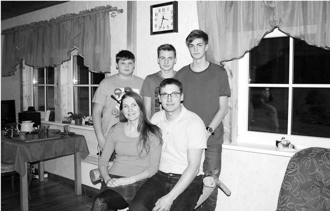
Pähnade pere elutoas, kuhu jõuluõhtul kogunevad ka lähemad sugulased.