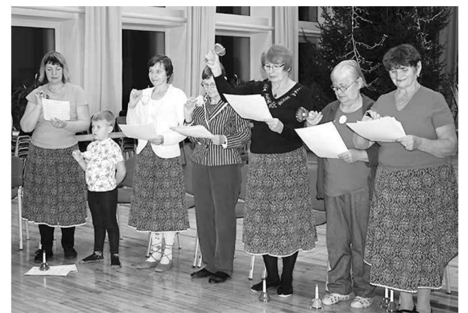
Proovisaalis. Käsi krampi!