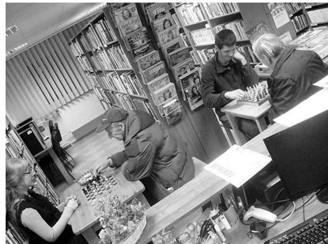
Hetk maleõhtust Kirepi raamatukogus.