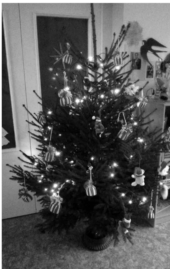
Parksepa lasteaia Uurijate rühma kuusepuu.