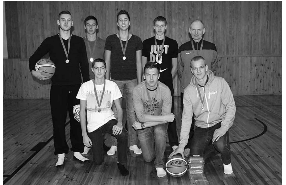
Parksepa SK/Võru korvpallimeeskond.

Palo sõnul oli meeskonnal finaaltorniiril enne mängu Urvastega juba kolm võitu käes ja kohtumiseks raske kontsentreeruda. „Tekkis-