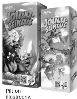
Pilt on illustreeriv.

Võru valla registris olevaid lapsi, kes on sündinud aastal 2000 ja hiljem ega käi valla koolides ja lasteaedades, oodatakse vallamaja kommipakkide järele. Pakid saab kätte sotsiaaltöötajate käest. Lisainfo tel 782 2713 ja 5326 8535.